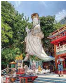
船の安全と大漁を祈る神様(昔、この周辺が漁村だったことに由来)