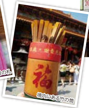
境内にある竹の筒