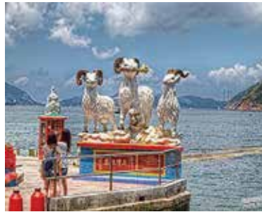
吉祥のシンボルとされる羊