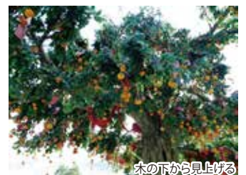
木の下から見上げる

ちなみにこの赤い短冊とみかんは本物ではなくプラスチック製。昔は本物のみかんを投げつけていたそうですが、みかんの重みで枝が折れてしまうため、最近ではプラスチック製のみかんで願掛けが行われています。大樹の周りには常に人だかりが出来ているので、負けずに願掛けしてみてください。