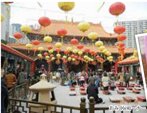
おみくじコーナー