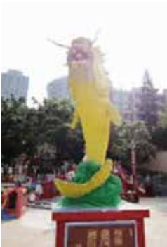
投げたコインが口に入れば願いが叶うという黄色い魚(鰲魚)