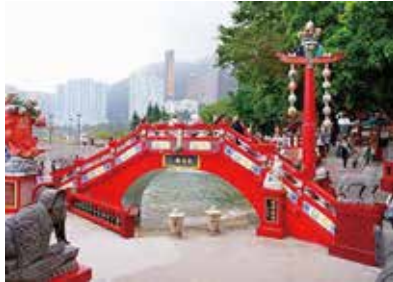
1回渡ると3日寿命が延びるという橋