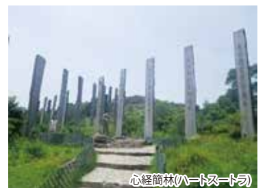
心経筒林(ハートストラ)