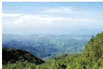
グラン・ピエドラ山

世界遺産となっているサン・ペドロ要塞、コンパイ・セグンドやペペ・サンチェスが眠るサンタ・イフィヘニア墓地、ソンの道、トロバの家、革命戦士の道、グラン・ピエドラ山など市内、郊外に世界遺産、音楽ゆかりの場所、キューバ革命の足跡、美しい自然と多彩な見所があります。ハバナとは趣の異なるサンティアゴ・デ・クーバは、是非訪れてほしい街です。