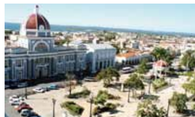
シエンフエゴス市内歴史・文化地区