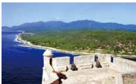
世界遺産 サン・ペドロ要塞