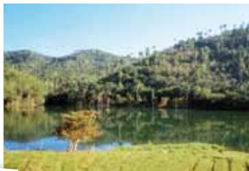
ピナル・デル・リオの風景

最高級のタバコの産地 ピナル・デル・リオは、キューバ本島の最も西に位置します。山々、丘、盆地が点在するその風景から「キューバの美しい庭園」と称されています。