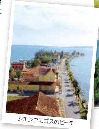
シエンフエゴスのビーチ

「南の真珠」と称される海沿いの街 シエンフエゴスには、フランス文化の影響を受けた要塞、ネオクラシック様式の美しい宮殿や建物、公園、劇場などが残っており、市内の歴史・文化地区は2005年7月にユネスコの世界遺産に指定されました。「建築物の宝石」と称される19世紀の建物がこの街を調和の取れた美しい街にしています。カリブ海に面したそのビーチは、ダイビングやマリンスポーツに最適です。