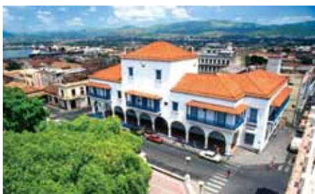
サンティアゴ・デ・クーバの町並み

1515年に築かれ短期間ではありましたがキューバの首都が置かれていた街です。現在は色々な民族・リズム・伝統・習慣がここで融合し、広く豊かな新しい文化を生み出し、カリブ海の「文化の首都」とも言えるでしょう。ソン・ボレロなどのキューバリズムのゆりかごと呼ばれたこの街の人々は、暖かく親切です。パコナオ自然保護地区の美しい海岸と澄み切った海水、切り立った緑濃い山々のコントラストの美しい街でもあります。