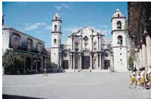
ハバナ市内 歴史保存地区