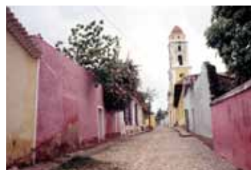
トリニダーの町並み