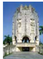
サンタ・イフィヘニア墓地