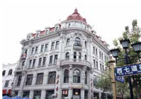
ハルビン中央大街のシンボル「教育書店」