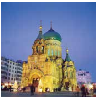
聖ソフィア大聖堂