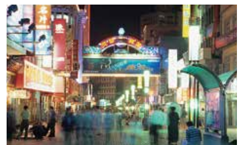
大連一の繁華街「天津街」