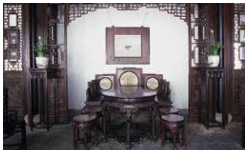
中小規模の古典庭園の代表作「網師園」の内部