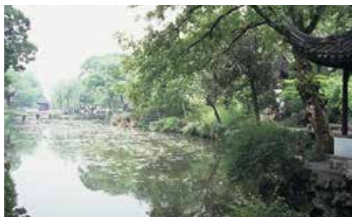
世界遺産・蘇州古典園林の中で最も規模の大きい「拙政園」