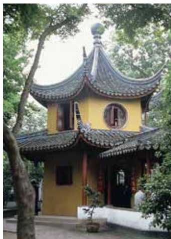
日本との交流もある「寒山寺」