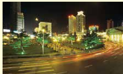
異国情緒あふれる建築物と、近代的なビル群が立ち並ぶ大連の街並み