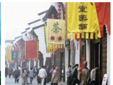
南宋時代の杭州の街並みを再現したショッピング街「清河坊街」