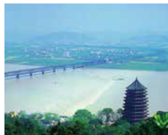
毎年十五夜の夜になると逆流現象が見られる大河「銭塘江」。手前に見えるのが「六和塔」