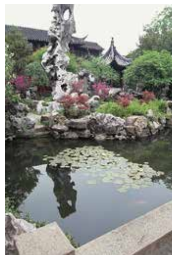
中国四大名園の一つにも数えられる「留園」