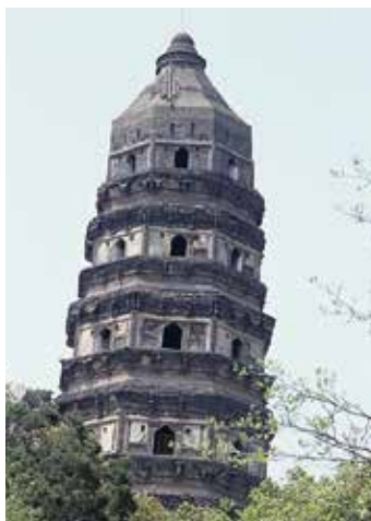
東洋の斜塔として名高い虎丘の「雲巖寺塔」