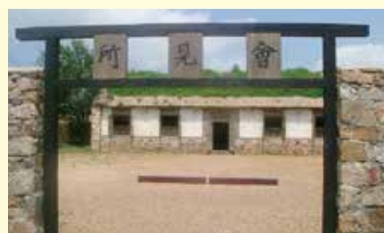
日露戦争の戦跡地「203高地」(左)と「水師管會見所」(右)