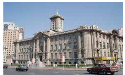
今も多くの欧風建築物が残る