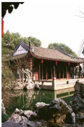
蘇州では、世界文化遺産に登録されている江南式庭園めぐりがおすすめ